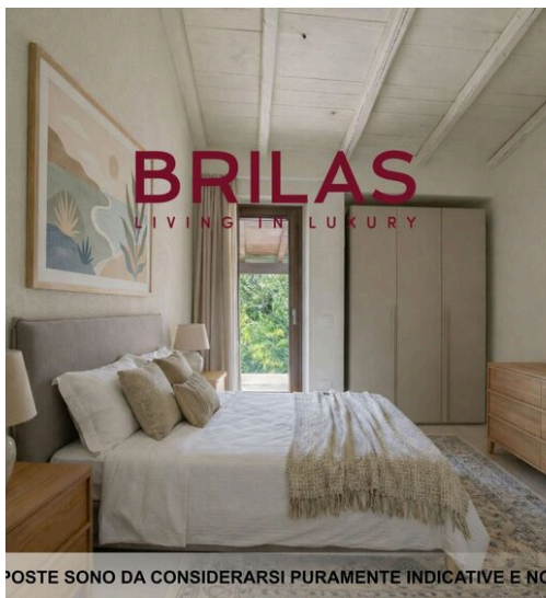
IMMAGINI PROPOSTE SONO DA CONSIDERARSI PURAMENTE INDICATIVE E NON VINCOLANTI