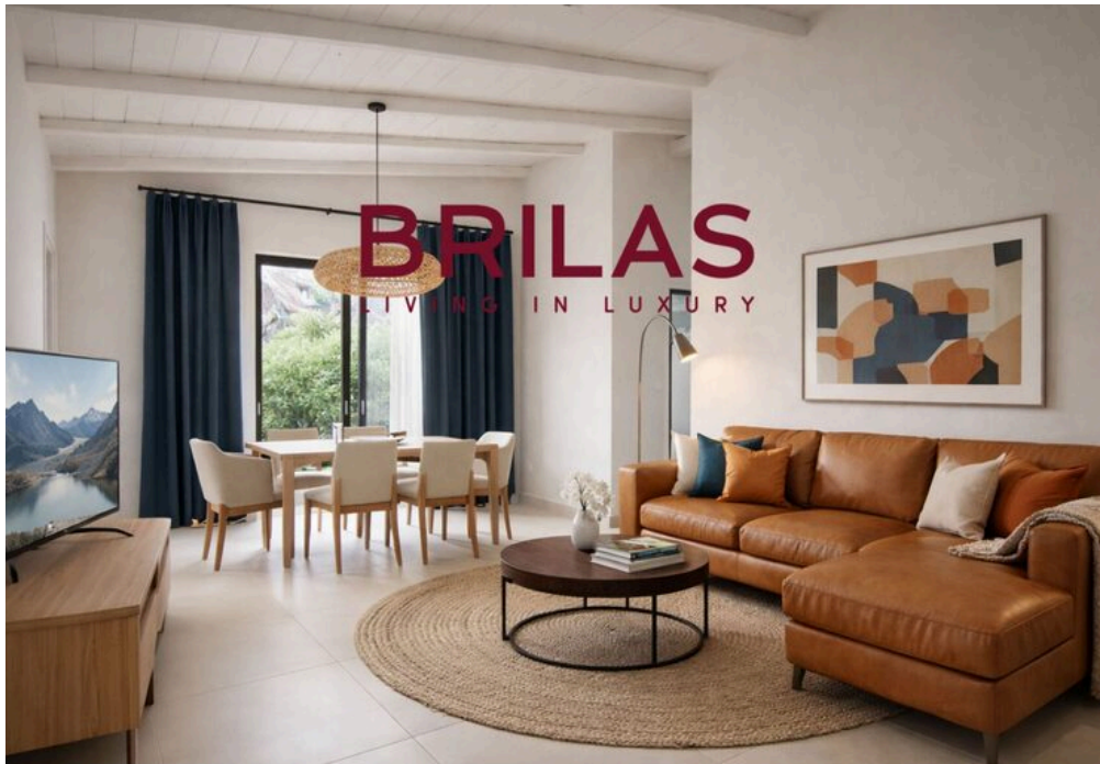
IMMAGINI PROPOSTE SONO DA CONSIDERARSI PURAMENTE INDICATIVE E NON VINCOLANTI