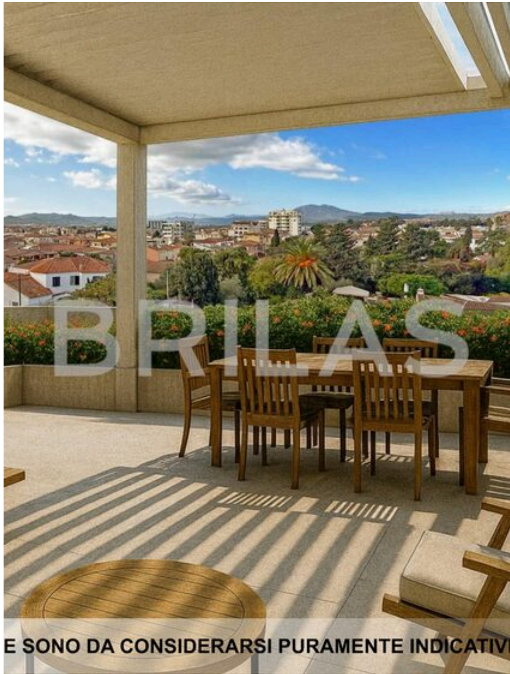
IMMAGINI PROPOSTE SONO DA CONSIDERARSI PURAMENTE INDICATIVE E NON VINCOLANTI