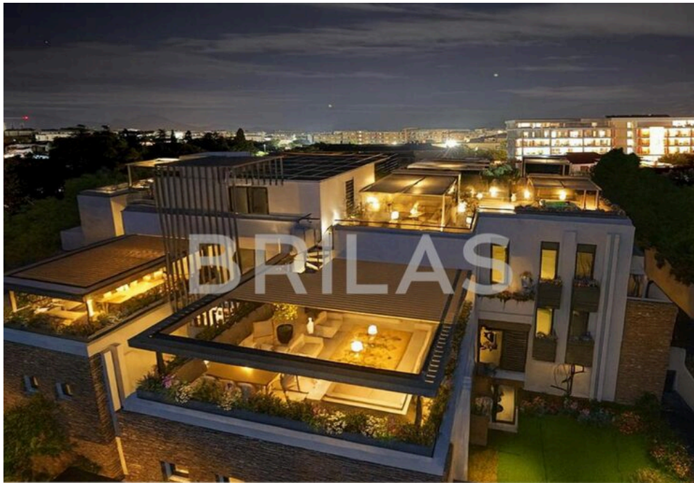
IMMAGINI PROPOSTE SONO DA CONSIDERARSI PURAMENTE INDICATIVE E NON VINCOLANTI