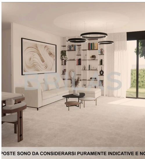
LE IMMAGINI PROPOSTE SONO DA CONSIDERARSI PURAMENTE INDICATIVE E NON VINCOLANTI