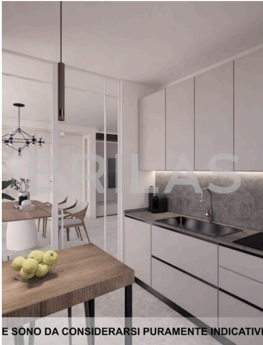
LE IMMAGINI PROPOSTE SONO DA CONSIDERARSI PURAMENTE INDICATIVE E NON VINCOLANTI