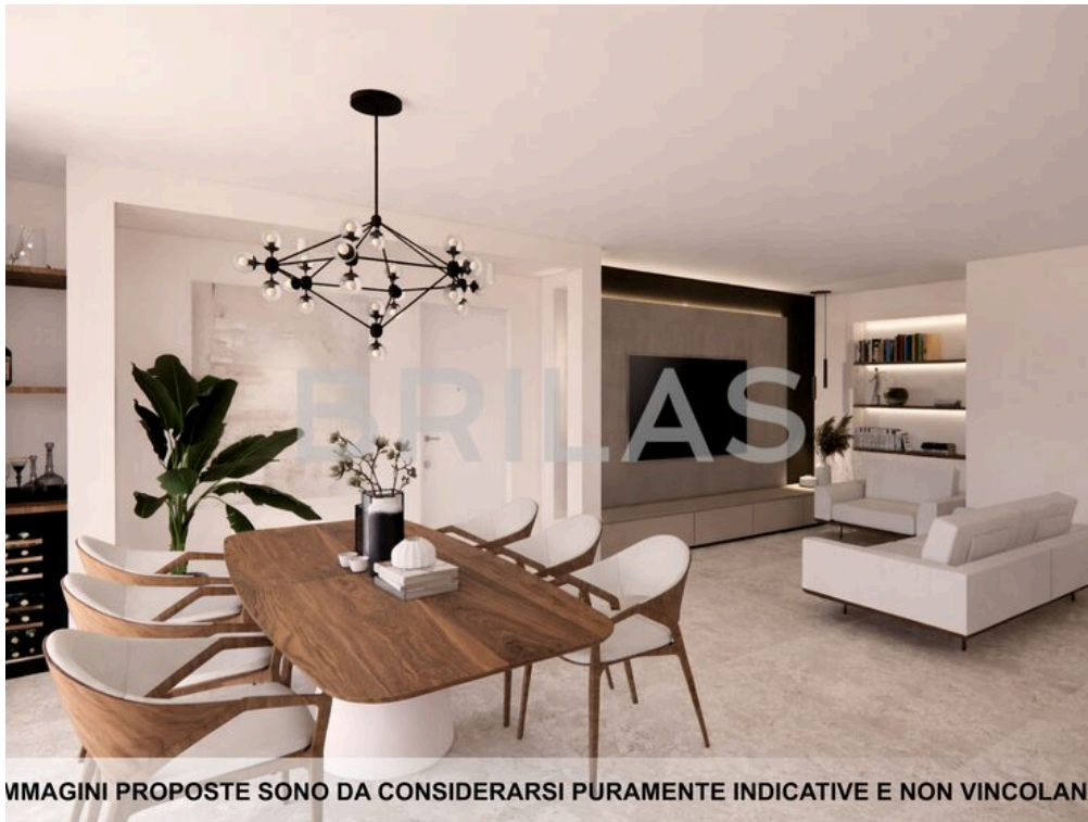
LE IMMAGINI PROPOSTE SONO DA CONSIDERARSI PURAMENTE INDICATIVE E NON VINCOLANTI